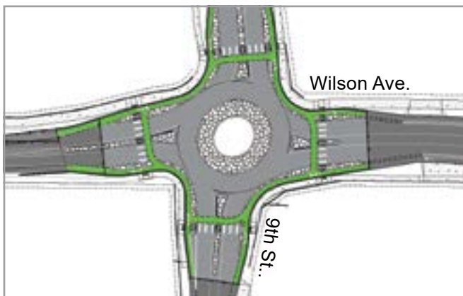
Wilson Avenue y 9th Street – Presentación preliminar de la rotonda del cruce.

El Proyecto de Mejoras de Wilson Avenue se extiende desde 2nd Street hasta 15th Street y actualmente se está diseñando. Este proyecto mejora la seguridad, conectividad de este a oeste y la infraestructura para andar en bicicleta y caminar. Además, se define como un proyecto de sinergia porque durante la construcción de la calzada se actualizará el sistema de la red de distribución de agua existente para adaptarlo a los estándares vigentes y los cables aéreos de servicios públicos pasarán a ser subterráneos.