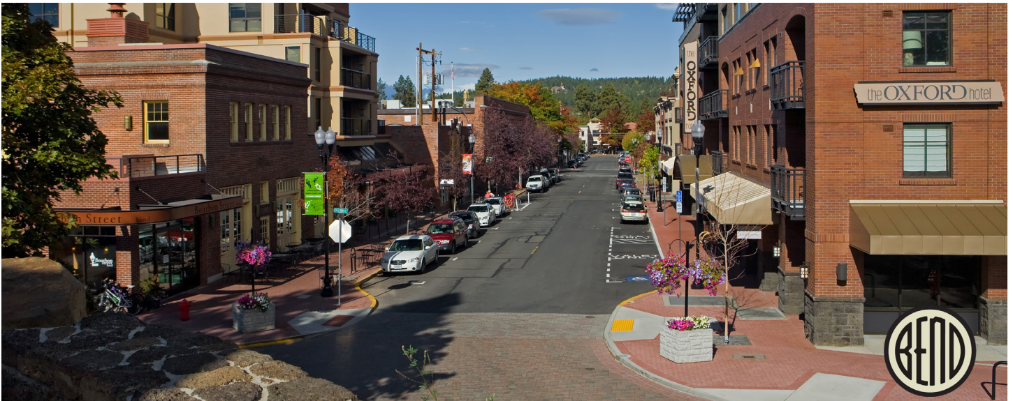
El centro de Bend se puede recorrer a pie